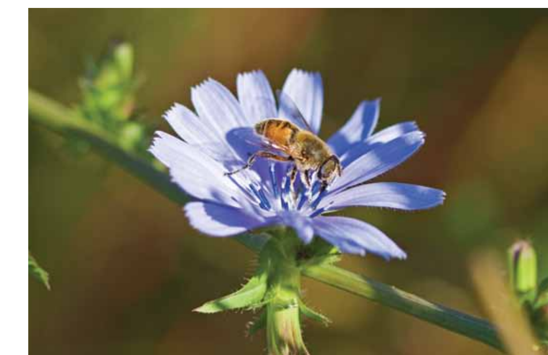
Wilde cichorei met blinde bij