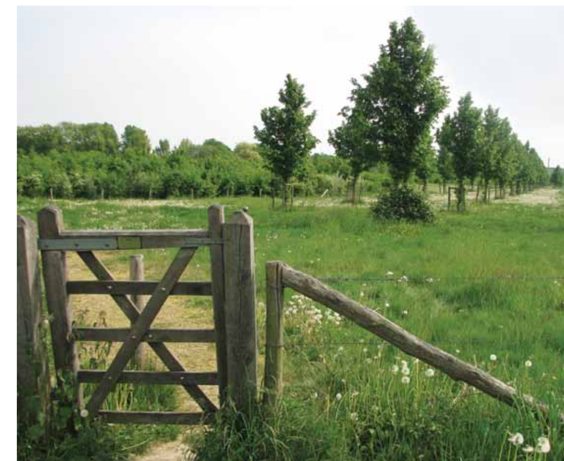
De entree naar een groene wandeling.

Hof van Limburg is een aantrekkelijk landschap aan de rand van Geleen. De slingerende fiets- en wandelpaden leiden naar verrassende doorkijkjes: van graslanden en bossen tot waterpartijen en speelvoorzieningen. Snuf de sfeer van buiten op!