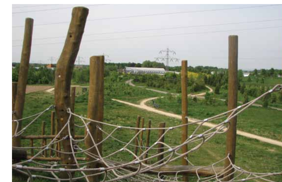
Speelheuvel voor urenlang speelplezier

Om de wateroverlast in de wijk Lindeneuvel te beperken, is het rioolstelsel aangesloten op een ondergronds opslagbekken (circa 2000 m 3 ). In het bekken wordt het regenwater tijdelijk opgeslagen of overgeheveld naar de permanente waterpartijen en infiltratiezones. In de infiltratiezones wordt het regenwater geïnfiltreerd in de bodem.