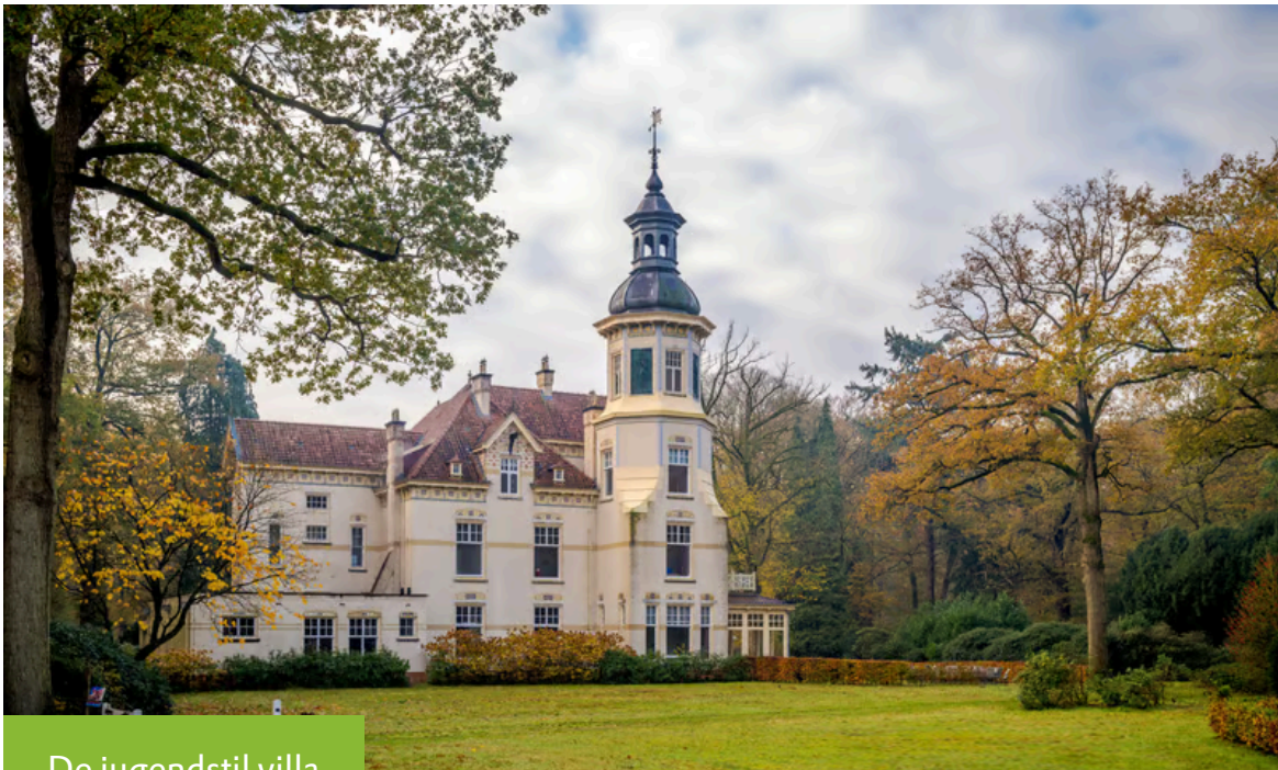
De Jugendstil villa